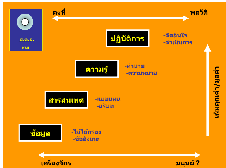
แผนภาพที่ 2

ในการจัดการสมัยใหม่ โดยเฉพาะอย่างยิ่งในยุคแห่งสังคมที่ใช้ความรู้เป็นฐาน (Knowledge-based society) มองความรู้ว่าเป็นทุนปัญญา หรือทุนความรู้สำหรับใช้สร้างคุณค่าและมูลค่า (value) การจัดการความรู้เป็นกระบวนการใช้ทุนปัญญา นำไปสร้างคุณค่าและมูลค่า ซึ่งอาจเป็นมูลค่าทางธุรกิจหรือคุณค่าทางสังคมก็ได้